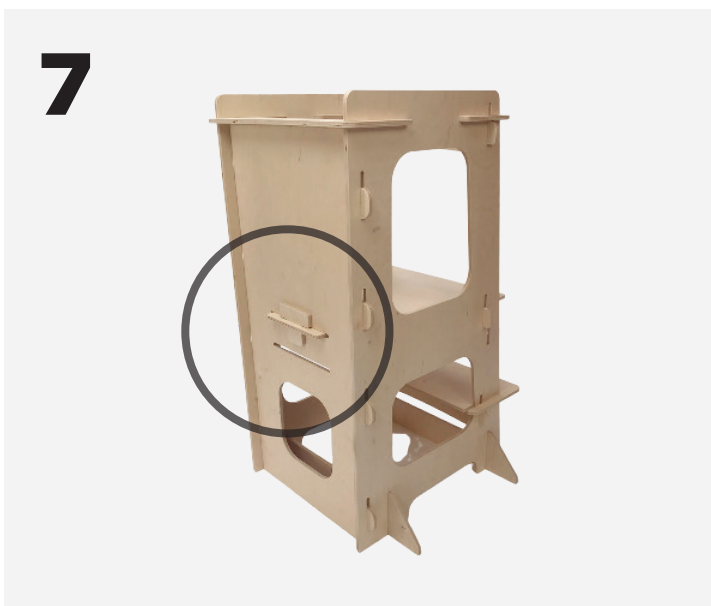
Stil tårnet op og husk at sætte kilen (H) i foran, så ståbrædtet (C) sidder ordentlig fast