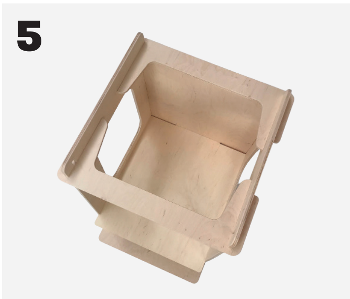
De 2 topbøjler (D) sættes på fra hver side.